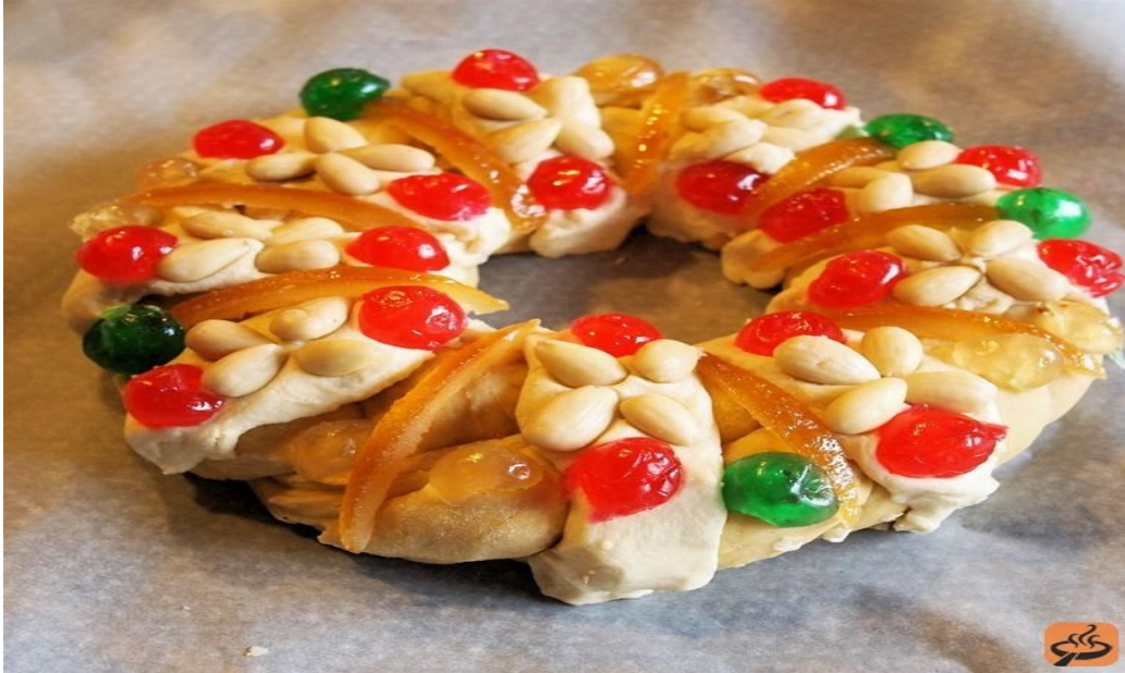
Rosca de Reyes... mňamka :p

balia sa do kukuričných alebo banánových sušených listov. Darčeky deťom nosí Santa Claus alebo Traja králi. Na sviatok Troch kráľov je zasa zvykom upiecť rosca de reyes, čo je sladký okrúhly koláč s kandizovaným ovocím. Je v ňom schovaná malá plastová soška Ježiška a kto ju nájde, stáva sa hosťiteľom na oslavy Hromníc /2. február/. Neodmysliteľnou súčasťou sviatkov je aj vianočná ruža, ktorá pochádza priamo z Mexika.