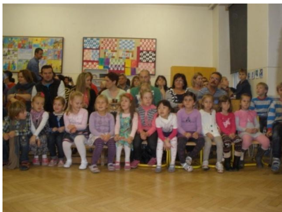
Sme plní očakávania!