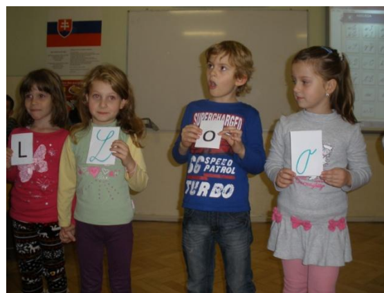
V krajine Písmenkovo!