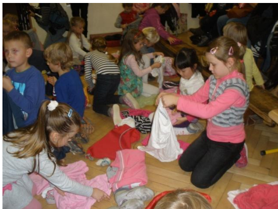
V krajine Šikovničkovo!